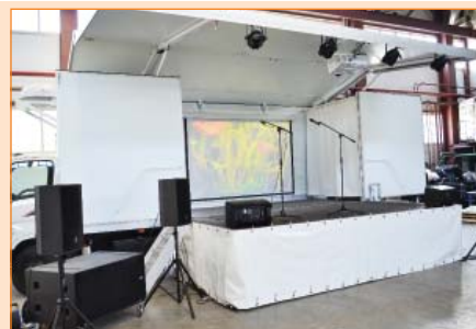
Внутренняя боковая стена кузова становится театральным задником или экраном для демонстрации кинофильмов или видеоматериалов.