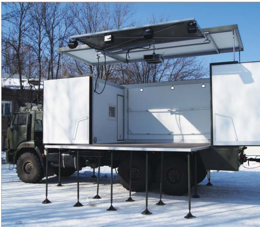
Площадь сцены от 20 кв. м с навесом от непогоды, позволяющая проводить выступления до 15 человек одновременно. В полу сцены встроены интегрированные опоры, опускающиеся под действием собственного веса.

ПАК комплектуется звуковым, световым и прочим техническим оборудованием с автономным источником электроэнергии.