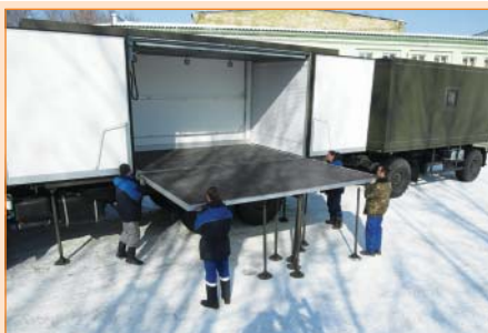
Время полного разворачивания 30 мин. Пол салона и выдвижная платформа сцены покрыты ламинированной противоскользящей водостойкой фанерой.