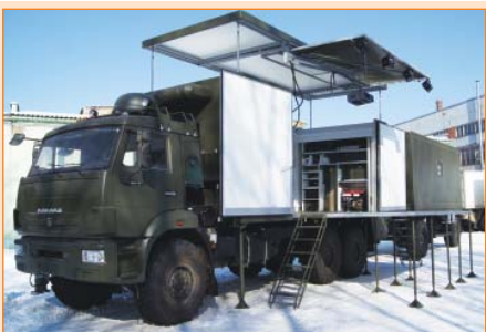
Подъем крыши осуществляется с помощью ручного гидронасоса и гидроцилиндров